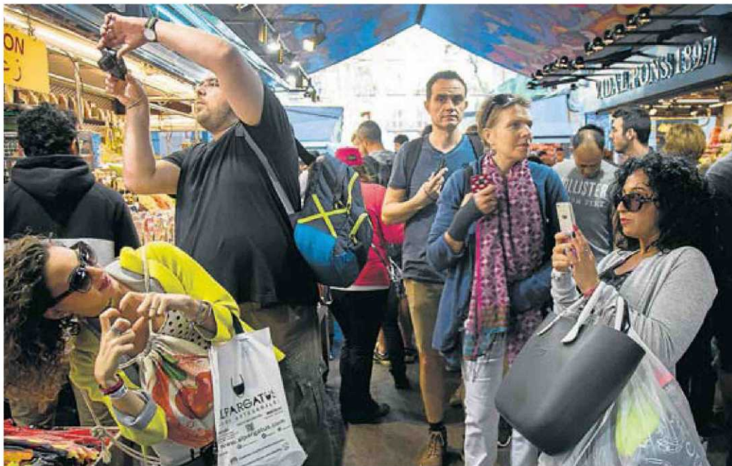
Diversos turistes fent-se fotos ahir al Mercat de la Boqueria de Barcelona, al barri del Raval.

Per nacionalitats, hi ha diferències en el rànquing Catalunya-Espanya. Al Principat, els francesos gua-