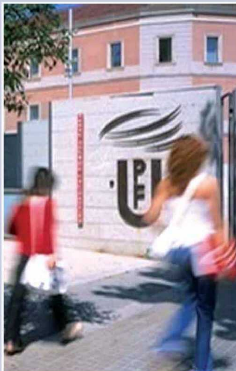
FONT: POLÍTICA DE PREUS PÚBLICS I EFICÀCIA DEL SISTEMA DE BEQUES UNIVERSITÀRIES A CATALUNYA / GRÀFIC: EL PUNT AVUI

L'autor de l'estudi va posar com a exemple de pràctica redistributiva que va en la mateixa línia el fet que l'Ajuntament de Barcelona hagi instaurat ajudes del 50% per a famílies de rendes baixes finançades amb l'augment d'aquest impost a les rendes altes.