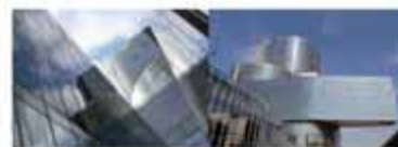
Nova Seu social de Gas Natural a Barcelona.

Líders del sector del gas a Espanya i a l'Amèrica Llatina, segon operador privat de Gas Natural Liquefiet de la Conca Atlàntica i tercera companyia del món en capacitat de generació d'electricitat amb cicles combinats de gas. Després de 165 anys acomplint els reptes que ens hem assenyalat, podem dir que ens continua agradant el futur que veiem. Un futur ple de compromís empresarial i de milions de clients arreu del món, als quals continuar portant el benestar, sempre amb el màxim respecte i sensibilitat pel medi ambient. www.gasnatural.com