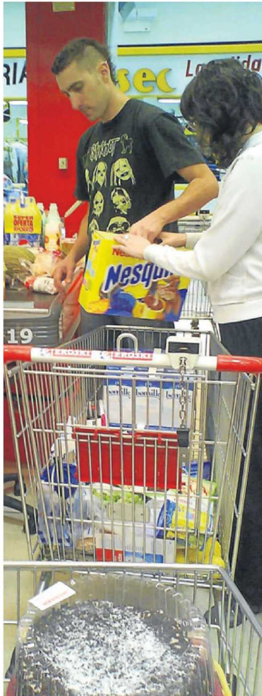
Dos jóvenes hacen la compra en un centro comercial.

Hace unas semanas, la ministra de Vivienda, Beatriz Corredor, animaba a los ciudadanos españoles a acelerar la compra de una vivienda porque a partir de julio las casas nuevas del mercado libre serán más caras por culpa del IVA. Así, según