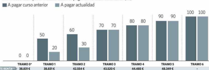
Parte de la tasa que el estudiante debe pagar en función de la renta (%)

(*) Alumnos que obtienen la beca general del MECD. (**) Renta anual en unidades familiares de 4 personas.