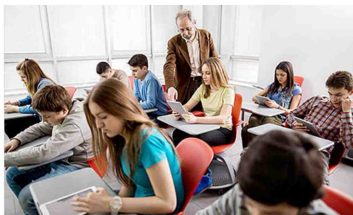
El número de alumnos se ha ido reduciendo drásticamente en los últimos años.

E l curso académico trae consigo cambios. Durante los últimos años, la vuelta a las aulas han supuesto un dolor de cabeza, puesto que en muchos casos venían acompañadas por universidades más caras y menos ayudas sociales para acceder a los estudios superiores. También, un dolor de cabeza para gobernantes, que tenían que hacer frente a unas políticas económicas y a la indignación social de las mismas. Este año se producirá una mejora - aunque sea discreta- en las condiciones de acceso de los estudiantes de la universidad, aunque sabe a poco. El Parlament había instado al gobierno catalán a que redujera este año un 30 por ciento las tasas, pero la reducción acordada en el Presupuestos para 2017 sólo se hará efectiva para familias de hasta cuatro miembros con ingresos anuales inferiores a los 39.000 euros.