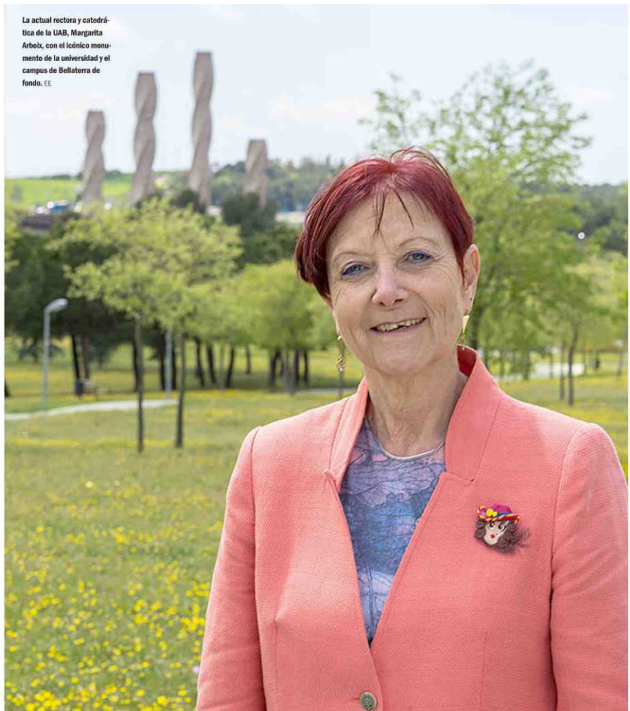
La actual rectora y catedrática de la UAB, Margarita Arboix, con el icónico monumento de la universidad y el campus de Bellaterra de fondo. EE

Asimismo, el Consell Interuniversitari de Catalunya también aprobó dar una moratoria de cuatro años a los estudiantes catalanes para poder acreditar el B2 en inglés, francés, alemán o italiano para poder pedir el título universitario.