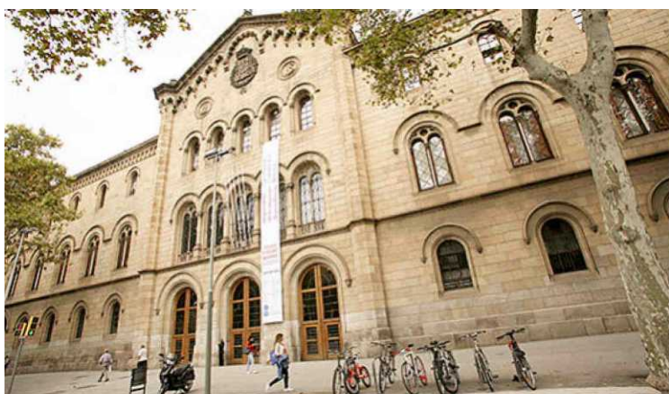
Las universidades públicas catalanas han vivido un encarecimiento progresivo de sus titulaciones y actualmente son las más caras de España. LUIS MORENO