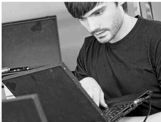
Las actividades de programación, consultoría e informática crearon 8.500 empleos en el primer trimestre.

Algunas industrias también se han colocado entre las que