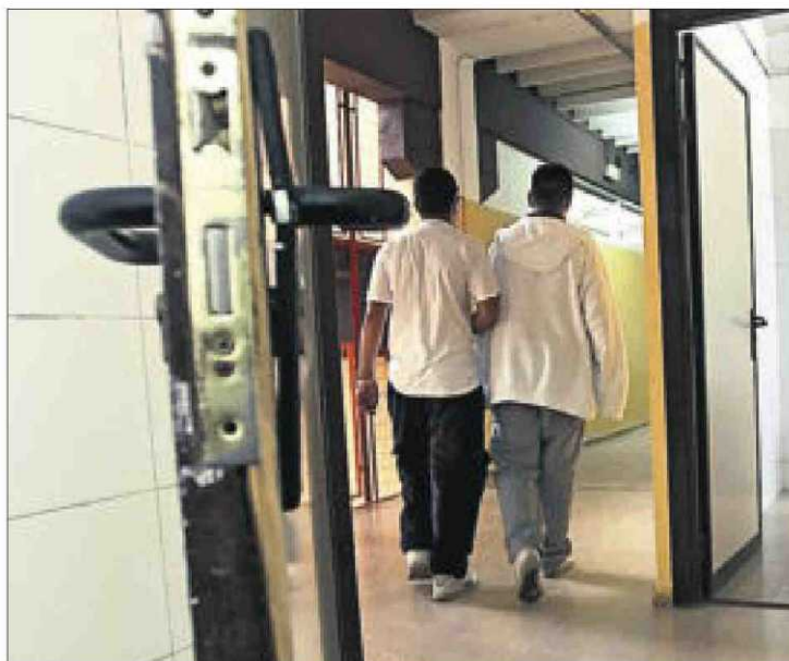
El objetivo español es reducir el abandono temprano al 15% en 2020. / C. R.

traen recursos en forma de recorres presupuestarios. A García-Montalvo le preocupa que gran parte de la bajada sea coyuntural, es decir, que se trate de jóvenes que vuelven a las aulas porque no tienen trabajo, pero que las dejen de nuevo en cuanto vuelvan a encontrarlo. Hay que tener en cuenta que al matricularse en alguna enseñanza dejan de engrosar las filas del abandono, y que eso incluye los cursos profesionales que ofrece el Ministerio de Traba-