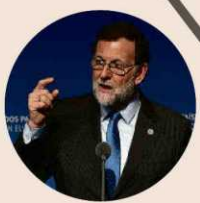
Diciembre de 2013 El Gobierno interviene el precio de la luz y suspende el anterior sistema de subasta eléctrica