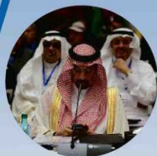
Diciembre de 2016 Los grandes países petroleros llegan a un acuerdo para recortar el bombeo de crudo, lo que dispara los precios.