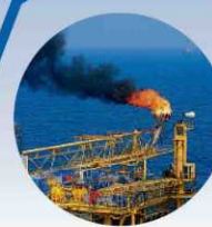
Enero de 2016 El precio del barril de petróleo Brent toca mínimos en 27,1 dólares.