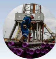
Octubre de 2014. El precio del petróleo se desploma por el auge del fracking en Estados Unidos.