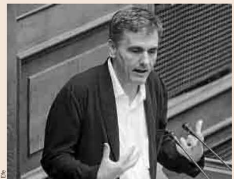
El ministro de Finanzas griego, Euclides Tsakalotos, ayer.

Pero por si no hubiera un acuerdo a tiempo, los socios europeos han pedido a la Co-