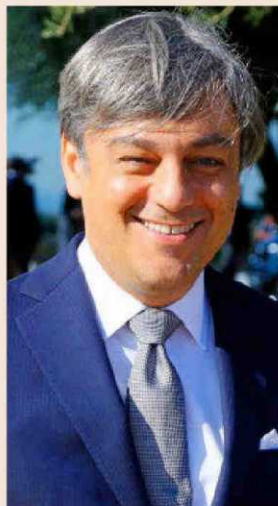
Luca de Meo, presidente de Seat.