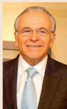
ISIDRO FAINÉ Presidente de Gas Natural y Fundación Bancaria La Caixa

El especialista en derecho tributario lee poca ficción, aunque de este género, recomienda por su emotividad Pedra de Tartera , de Maria Barbal (Edicions 62). También destaca los ensayos El valor de actual , de Ben S. Bernanke (Península), sobre "la crisis financiera, la gestión de situaciones de máxima dificultad y la evolución del Partido Republicano de los EEUU".