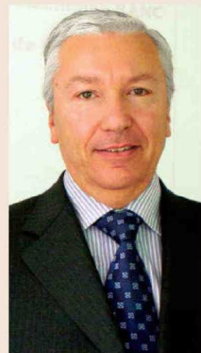
Antoni Abad, presidente de la patronal Cecot.