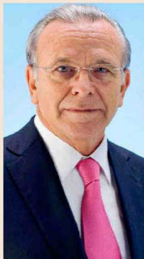
Isidro Fainé preside Gas Natural y la Fundación La Caixa.