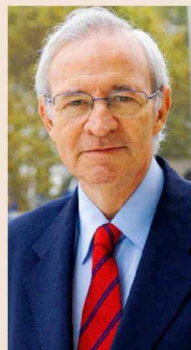
Miquel Valls preside la Cámara de Comercio de Barcelona.