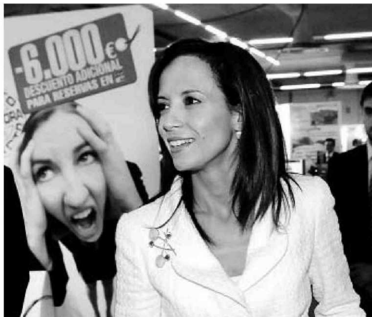
La ministra de Vivienda, Beatriz Corredor.

Pero la cosa no queda ahí, porque desde 2011 desaparecerá para quienes cobren más de 24.000 euros (los únicos que pueden comprar ese piso medio) la deducción fiscal por vivienda habitual. Esta medida provocará una subida tributaria evidente, de más de 250 millones de euros al año, y mitigará el ajuste de los precios de las casas en alrededor de 10 puntos porcentuales,