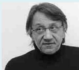
MICHELE BOLDRIN Profesor de la Universidad de Washington en San Luis

“El documento presentado por Pablo Iglesias habla de gasto pero sin decir en qué. Si se busca la rentabilidad social, eso significa que no tiene rentabilidad económica, pero entonces no se mejora la productividad y no hay forma de pagar las deudas. Así se vuelve a los mismos problemas de deuda que causaron la crisis. Por otra parte, si aumenta la masa monetaria sin mayor una producción, eso se traduce en inflación y, a futuro, más impuestos para las clases medias”.