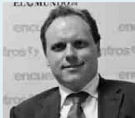
DANIEL LACALLE Autor de 'Nosotros los mercados' y 'La madre de todas las batallas'

“Es una propuesta que parte de una ideología, pero que no es viable en la práctica y, de hecho, el Erario no lo podría financiar. El incremento de las cotizaciones a la Seguridad Social no es viable, porque somos uno de los países más caros de Europa junto a Francia y así se incentivaría el fraude fiscal; no se puede fijar convenios a nivel europeo porque las condiciones son muy diferentes; y no se puede topar el salario máximo porque los directivos emigrarían”.