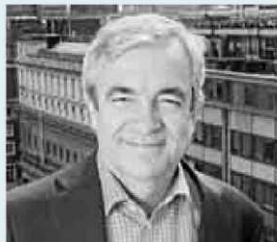
LUIS GARICANO Profesor de Economía y Estrategia en London School of Economics

“Volver a la banca pública no es una buena idea, porque es menos eficiente y porque el Instituto de Crédito Oficial no tiene experiencia ni medios para valorar el riesgo de las operaciones. Sin embargo, si el crédito es ‘un bien público’ esencial para la economía, como ellos defienden, el banco debe ‘crear’ en la solvencia del prestatario. También dicen que se han dado 130.000 millones en ayudas a la banca cuando el Banco de España cuantifica 61.000 millones”.