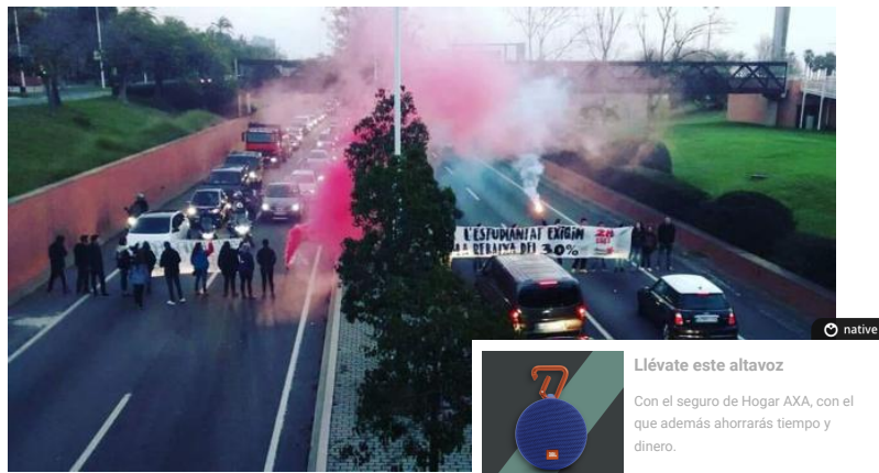
Protesta estudiantil en la Ronda Litoral para reclamar una reducción de las tasas universitarias

“Las causas de las caídas (en el número de matriculados en España) habría que buscarlas en la reducción de la población en la edad típica universitaria pero también en las fuertes subidas de los precios públicos universitarios (20% de promedio) y en el endurecimiento de las condiciones para obtener y mantener una beca”, apuntaba el CyD. ( http://www.fundacioncyd.org/images/informeCyD/2015/Cap1_ICYD2015.pdf )