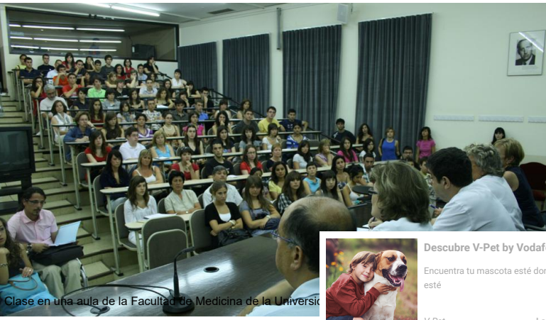
Clase en una aula de la Facultad de Medicina de la Universid

Los estudiantes reclaman que se haga efectiva la moción para reducir las un 30% que aprobó el Parlament en 2016, pero la Generalitat cree que la medida beneficia a los ricos