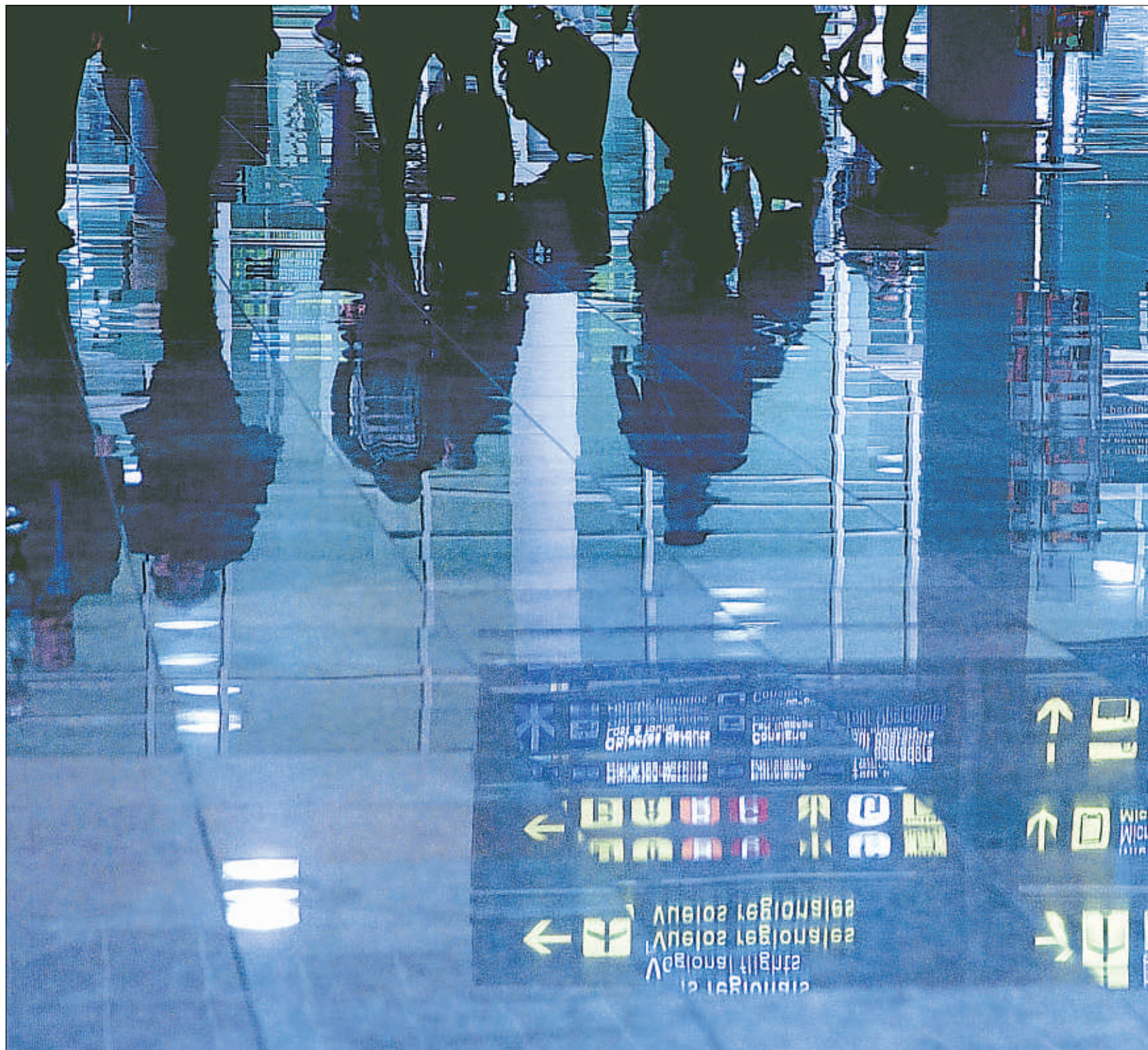
Las terminales cerrarán el año con una cifra histórica de pasajeros, que rondará los 34 millones

Estos buenos resultados se producen sin que se sepa a ciencia cierta qué pasará con el proceso de privatización de El Prat, que sigue retrasado. Sea como fuere, el aeropuerto le debe mucho a Ryanair, que comenzó a operar en este aeropuerto en septiembre del 2010, y le ha dado un fuerte empujón. Justo lo contrario que en Girona y Reus, que han caído en picado por su marcha. Sólo dos meses después de la llegada a Barcelona, esta low cost se situó como la tercera compañía y desplazó a EasyJet. La primera