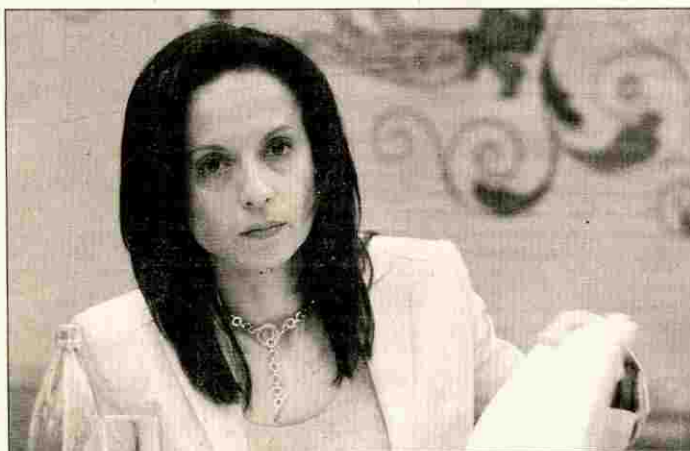
Corredor, registradora de la propiedad y con una importante experiencia a sus espaldas, se ha visto desbordada por la mayor crisis inmobiliaria en décadas.