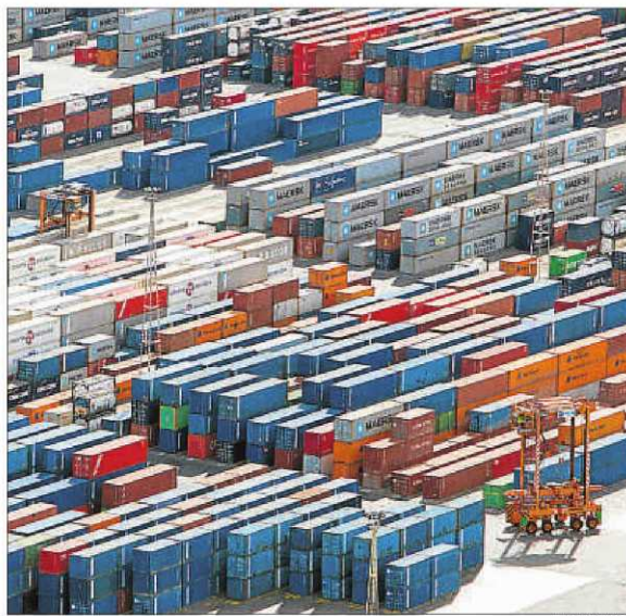
Contenidors al port de Barcelona

en exportació van ser el de l'alimentació, begudes i tabac (en què les vendes van augmentar un 6,2% i van representar el 16,1% del total) i el de l'automòbil (en què van créixer un 5,3% i suposen el 15,1% del total).