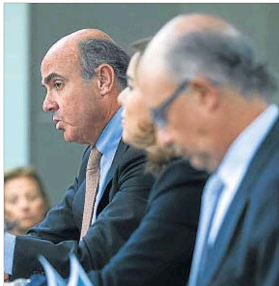
Guindos, Santamaría y Montoro presentaron los presupuestos

El ministro justificó que España crecerá de la mano de la de-