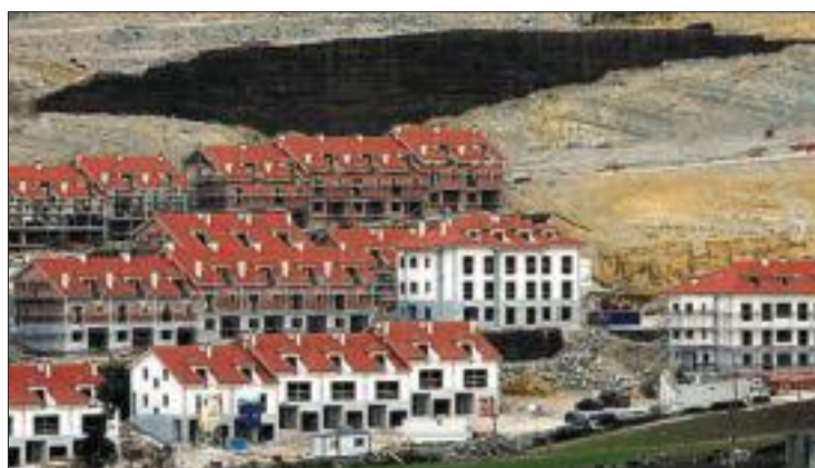
Las construcciones en la costa han servido de pantalla a algunos fraudes.

aportan información falsa al solicitar la hipoteca, ya sea con respecto a sus ingresos o a otras obligaciones financieras, con el fin de poder financiar la vivienda que desean. O bien, cuando el fraude afecta a la declaración de las obligaciones o pasivos del solicitante, y se produce cuando el prestataria oculta o no revela otras obligaciones que pueda tener. Un ejemplo claro serían las deudas con tarjetas de crédito recientes con el fin de reducir el importe de las deudas mensuales declaradas por el solicitante. Una vez más, las oportunidades para cometer este tipo de fraude han aumentado en los últimos años debido a que algunas entidades