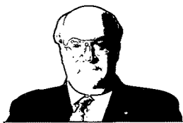
Andreu Mas- Colell