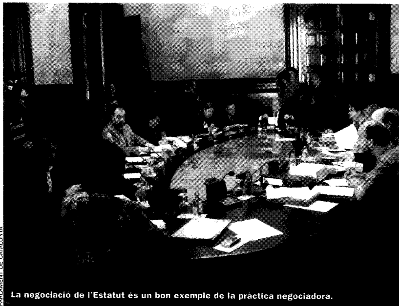
PARLAMENT DE CATALUNYA

1. Suposem que, com ha estat el cas, obrir la negociació és prerrogativa d'una de les parts, i que la negociació es costosa. Triar el moment d'iniciar-la és, doncs, fonamental, ja que, arribi o no a bon port, no se'n podrà endegar un altre fins que hagi passat un període llarg. Els historiadors hauran de dir si la negociació de l'Estatut es va obrir en un moment propici. Però això ara és aigua passada. El cost de la negociació ja s'ha pagat i l'absència d'acord no avançaria la data d'una represa. De fet, el fracàs, i la memòria que se'n tingui, tindria un efecte inhibitor tan considerable que els anys que passessin fins a una nova negociació podrien ser més en la hipòtesi de fracàs que en la d'acord.