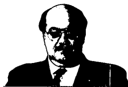
Andreu Mas- Colell

Els preus són conseqüència de l'acció de l'oferta i la demanda. Pel que fa al petroli, hi ha hagut un augment extraordinari de la demanda, induït per un fet positiu: el creixement econòmic de la Xina (i d'altres països). D'aquí ve l'augment del preu. El que passi en els propers anys dependrà del que els economistes en diem l'elasticitat