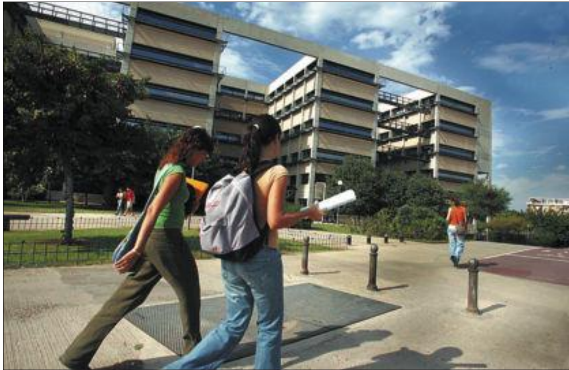
La tasa de titulados en la universidad estaba en 2005 tres puntos por debajo de la media de la OCDE.

El cálculo que se ha hecho consiste en sumar la ventaja salarial de un titulado superior, la rapidez con la que encuentra trabajo o la pensión que se cobrará, y restarle el dinero y la experiencia que deja de ganar mientras está estudiando y lo que le cuesta la carrera. España es donde menos compensa a los hombres, y las mujeres, aunque un poco mejor, se quedan las séptimas por la cola. La ventaja comparativa de un titulado superior español con alguien que tiene bachillerato o FP de grado medio es de un 4,9% para los hombres por cada año de estudio, y del 6,5% para las mujeres, mien-