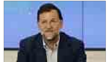
Mariano Rajoy, presidente del PP.

Debate. Desayuno informativo del Fórum Europa, organizado por Nueva Economía, cuyo ponente principal será Mariano Rajoy, quien comentará los últimos acontecimientos económicos y la presencia de España en la reunión del G-20.