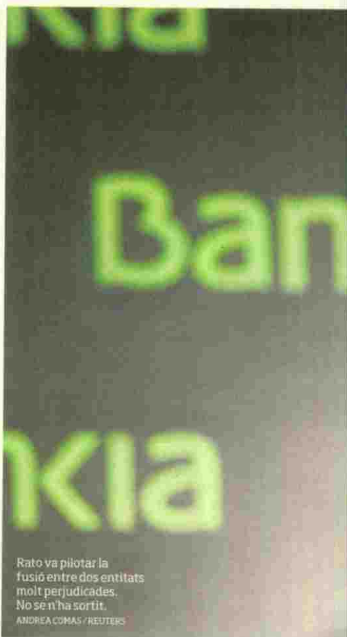
Rato va pilotar la fusió entre dos entitats molt perjudicades. No se n'ha sortit.

A Rodrigo Rato li va sorgir l'oportunitat d'anar al Fons Monetari Internacional (FMI) com a director gerent. Tradicionalment aquest càrrec ha estat en mans d'un europeu, i la bona entesa que José María Aznar tenia amb George Bush i Vladímir Putin va permetre que Rato (aleshores molt ben