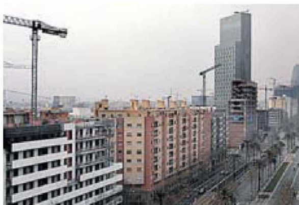
Tot i la debilitat de les vendes, es continua construint a ciutats com Barcelona. FRANCESC MELCION

El retrocés inesperat de vendes sembla un mal auguri per a un sector que encara ha de pair molts excessos. Els experts anticipen que la situació està lluny d'estabilitzar-se, amb uns preus massa alts en comparació amb el salari mitjà. Amb aquestes xifres, el 2011 no té números per ser l'any de la recuperació.