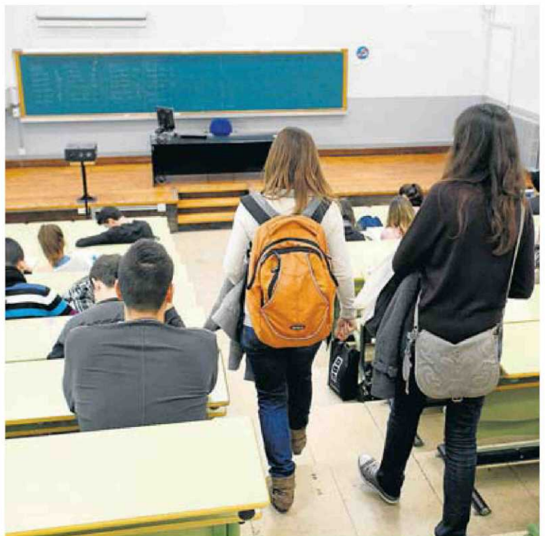
Estudiants de la Facultat d'Economia i Empresa de la Universitat de Barcelona (UB) entrant a l'aula.

En canvi, segons Montalvo, un exemple de coherència –va assegurar– és la Comunitat de Madrid. “Tenen els impostos més baixos d'Espanya i és lògic que abaixin els preus públics de la matrícula”, va argumentar. També va apuntar que, si es vol una universitat gratuïta com a Alemanya o Dinamarca, el primer