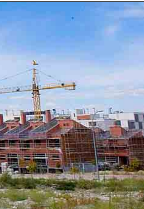
Imagen de archivo de casas en obras en un barrio de Madrid.

La crisis económica, con su consiguiente sequía de crédito, y la futura política estatal continuarán impulsando el arrendamiento en detrimento de la propiedad. Por J. S. C.