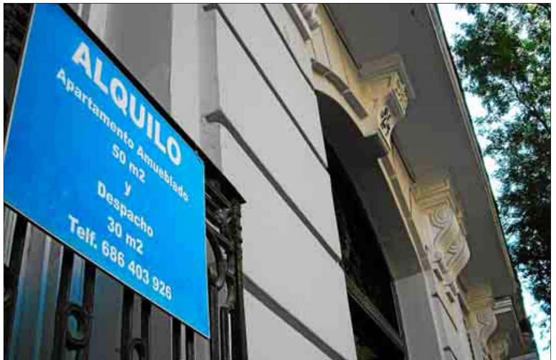
Cartel que anuncia una vivienda en alquiler en el centro de Madrid fijado en uno de sus balcones.