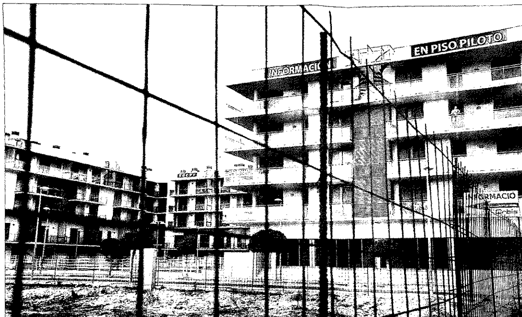
Apartamentos de obra nueva en venta en primera línea de mar, en Cambrils.