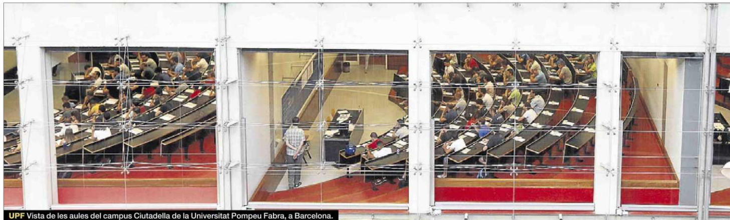
UPF Vista de les aules del campus Ciutadella de la Universitat Pompeu Fabra, a Barcelona.