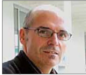
CATEDRÀTIC D'ECONOMIA APLICADA DE LA UNIVERSITAT POMPEU FABRA

"Excepte en casos particulars, l'economia catalana està aguantant molt bé la depreciació del dòlar, millor del que pensàvem. Perquè gran part del comerç exterior de Catalunya es fa amb Espanya o amb la Unió Europea. I, d'altra banda, està augmentat el valor afegit de les nostres importacions, fet que ens fa menys vulnerables".