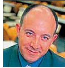
DOCTOR EN ECONOMIQUES PER LA UNIVERSITAT DE BARCELONA

"La fortalesa de l'euro en facilita la conversió en moneda de referència per al comerç internacional, en perjudici del dòlar. Molts bancs centrals asiàtics, que mantenen les reserves en dòlars, estan modificant les seves carteres de divises i denominació d'actius financers. També alguns productes i serveis internacionals han passat a euros els preus, fins al punt que moltes cotitzades des de fa mesos només accepten pagaments en euros".