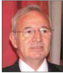
PRESIDENT DE LA CAMBRA DE COMERÇ, INDÚSTRIA I NAVEGACIÓ DE BARCELONA

"Les empreses catalanes han de potenciar les compres internacionals, perquè el context actual ho afavoreix. L'apreciació de l'euro situa en una excel·lent posició les companyies del país per posicionar-se als Estats Units, i també en països de la seva zona d'influència com ara Mèxic, que és una boníssima porta d'entrada al mercat nord-americà".