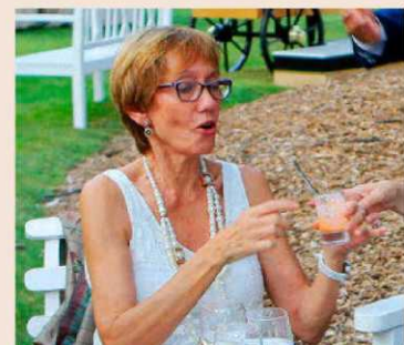
Eugenia Bieto, directora general de Esade.