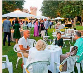
Los asistentes degustaron una cena antes del concierto del cantautor Franco Battiato.