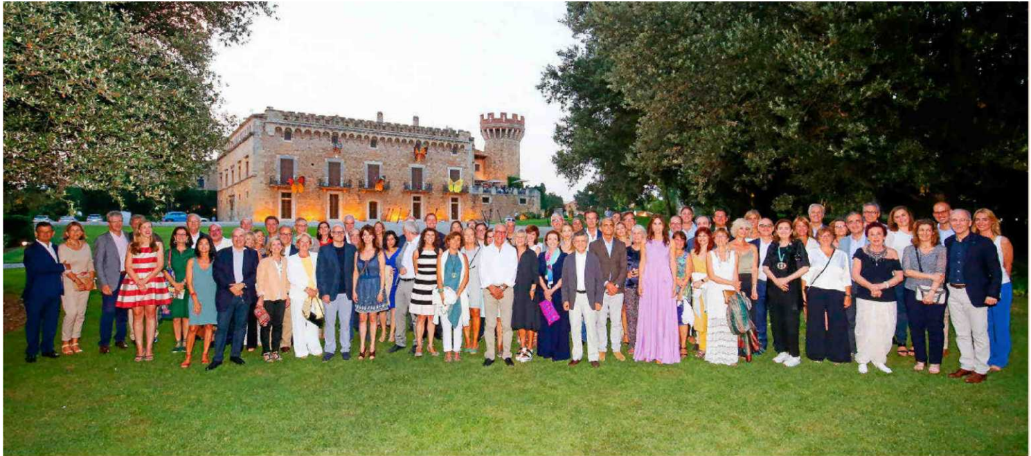
El encuentro organizado por EXPANSIÓN en el Castillo de Peralada reunió a unas cien personas del ámbito empresarial, económico y académico el pasado sábado. Tras degustar un cóctel en el que pudieron intercambiar impresiones, los invitados asistieron a un concierto del italiano Franco Battiato, que demostró estar todavía en plena forma para cantar.