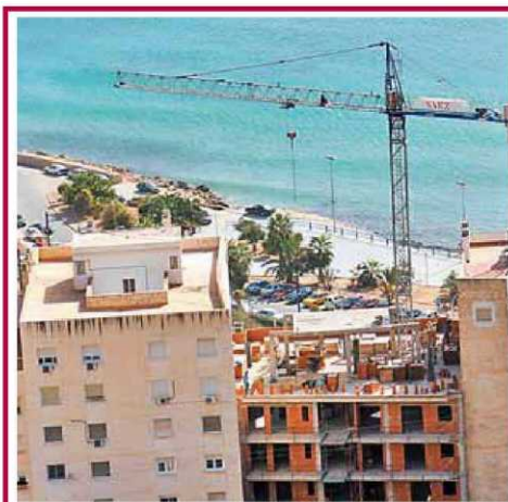
Las costas de Murcia y Alicante han tenido más bajadas.