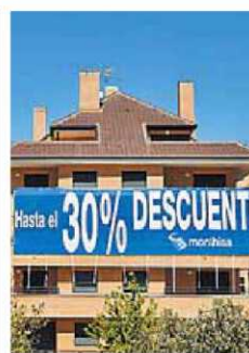
Ahora hay más descuentos.

2 Promotores. Desde los principales organismos que los representan se lleva ya unos meses diciendo que no se pueden hacer más recortes. Hay situaciones en las que "no pue-