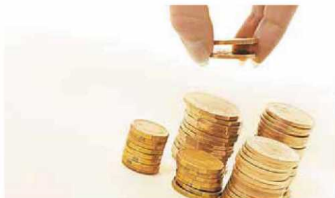
Con el final del año se acerca el momento de hacer balance.