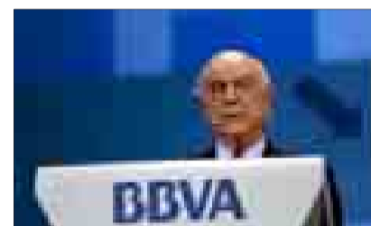
El presidente del BBVA, Francisco González.