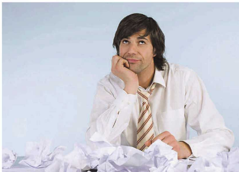
Desempeñar un puesto por debajo de sus posibilidades acaba produciendo frustración en los profesionales